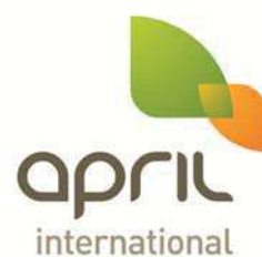
TABLEAU DE GARANTIES