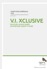
VOS CONDITIONS GÉNÉRALES DÉTAILLANT LE FONCTIONNEMENT DE VOTRE CONTRAT,