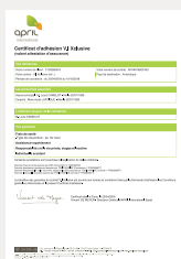
VOTRE CERTIFICAT D'ADHÉSION VALANT ATTESTATION D'ASSURANCE,